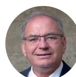
Bernard PERRUT Député du Rhône, Maire Honoraire de Villefranche- sur-Saône