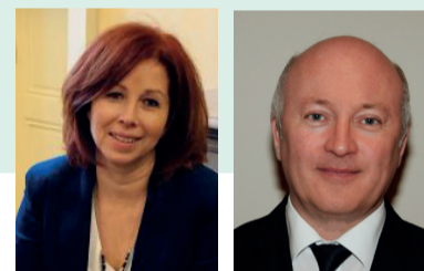
Pilotes de la démarche de RETEX avec l'accompagnement du cabinet Efficience Santé

N'hésitons pas, profitons-en et soyons tous acteurs du changement !